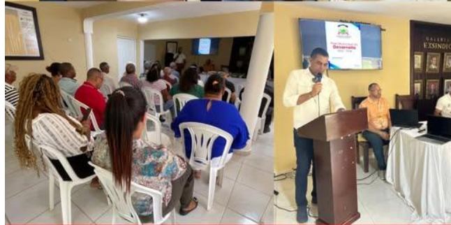
“Presentación del Plan Municipal de Desarrollo 2024–2028”